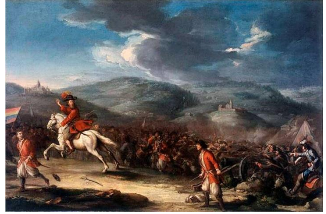
Flucht der Innerschweizer - Villmergen 25.07.1712