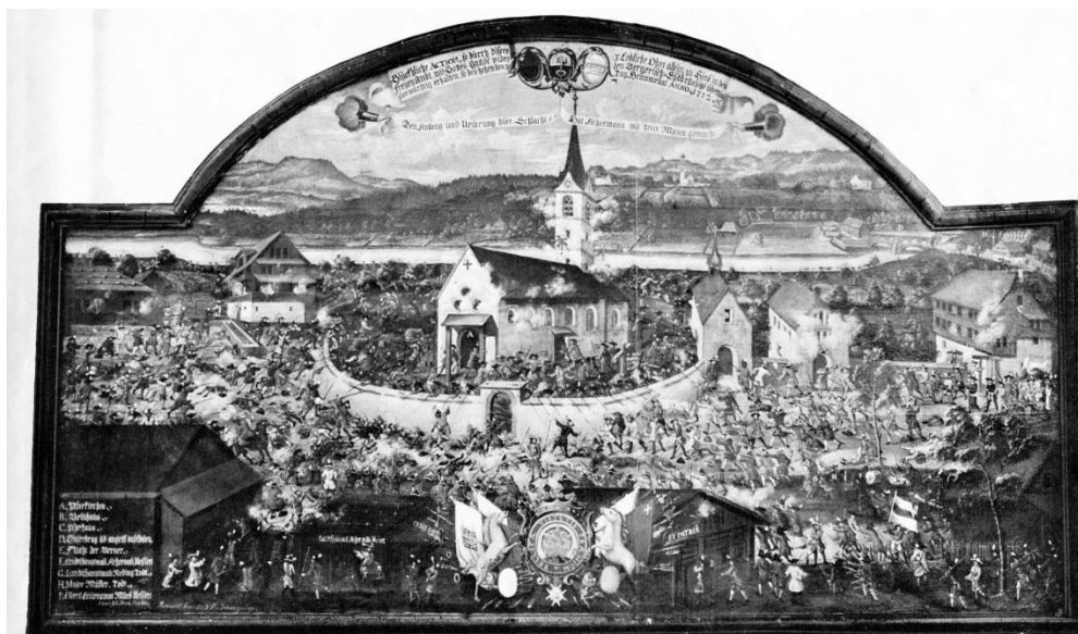
Treffen bei Sins vom 20. Heumonats 1712

An der Rückwand des Hauptraums hängt der grosse, auf Leinwand gemalte Prospekt des Treffens bei Sins, auf dem die bereits erwähnte Eigenart Stricklers: durch Sprüche, legendäre Hinweise etc. den Gegenstand dem Beschauer möglichst verständlich vorzuführen, deutlich bemerkbar ist. „Das Bild zeigt, auch in seinen landschaftlichen Partien, ein ganz respektables Können des Malers Strickler“ bemerkt Dr. Robert Durrer.