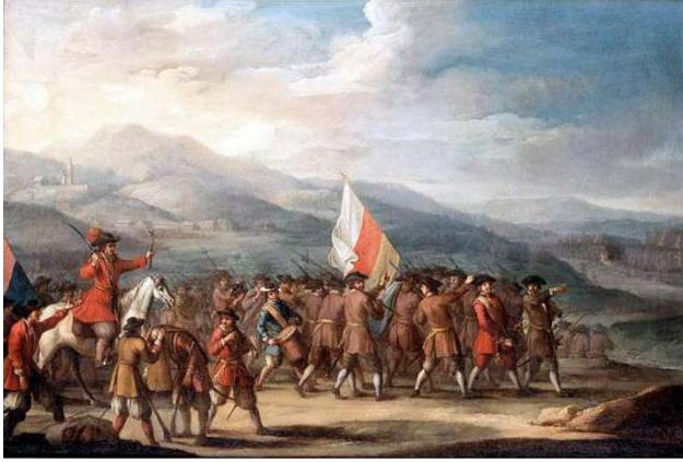
Auszug der Innerschweizer - Villmergen 25.07.1712