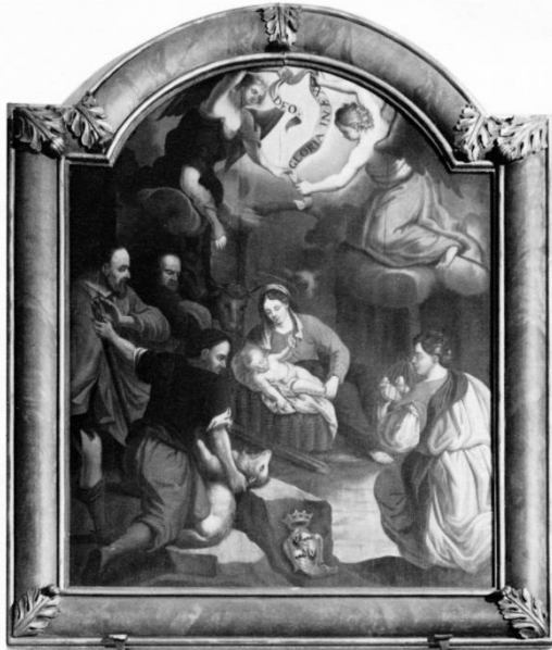
Anbetung der Hirten